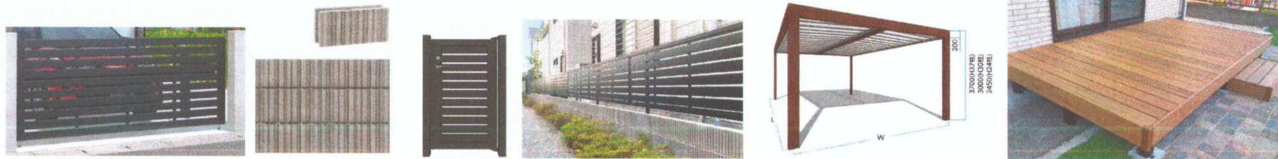
写真はご提案内容と仕様及びカラーが異なる場合があります。